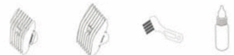
Насадка ребень 6 мм Насадка гребень 9/12 мм Кисточка для чистки Масленка